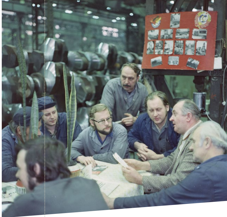
Treffen der Abteilungs- parteiorganisation der Brigade „Julius Fucik“ im VEB „Heinrich Rau“ in Wildau bei Berlin im Jahr 1976

An ihren Arbeitsplätzen sollten die Parteimitglieder im Sinne der SED wirken und eine Klammer zwischen dem SED-Regime und der Gesellschaft bilden. Sie sollten ihre Kolleginnen und Kollegen von der Politik der Partei überzeugen bzw. Parteibeschlüsse umsetzen. Dieser Anspruch der SED drückte sich in dem Leitspruch „Wo ein Genosse ist, da ist die Partei!“ aus. Gleichzeitig sollten Parteimitglieder wachsam sein und an ihrem Arbeitsplatz Entwicklungen sowie das Verhalten ihrer Kolleginnen und Kollegen beobachten. So erhielt der Parteiapparat Informationen darüber, wo es Probleme gab, und konnte handeln, wenn er dies für die eigene Herrschaftssicherung für notwendig erachtete. Diese Informationen waren Teil eines umfassenden Berichtswesens, das von der Parteibasis bis in die Parteiführung reichte. SED-Mitglieder sollten auch mit Personen reden, die sich den Regeln der SED-Diktatur entzogen oder diese auch nur in Frage stellten. Darunter waren häufig Menschen, die nicht an der Wahl teilnahmen oder einen Ausreiseartrag gestellt hatten. Solche Gespräche sollten einschüchtern und die Menschen zur Folgebereitschaft zwingen. Die Genossinnen und Genossen übten soziale Kontrolle aus. Darüber hinaus gab es in der DDR viele andere Akteurinnen und Akteure, die über Menschen in ihrem sozialen Umfeld berichteten und damit zum Erhalt der SED-Herrschaft beitrugen. Am bekanntesten sind die „Inoffiziellen Mitarbeiter“ der Stasi.