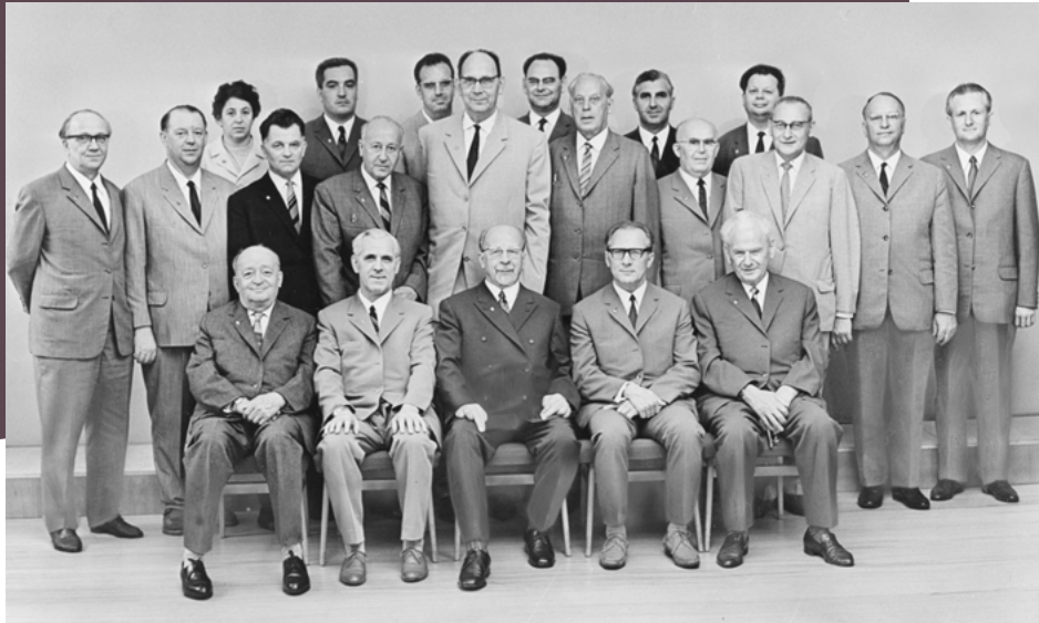
Politbüro des Zentralkomitees der SED im Juli 1968

Das tatsächliche Machtzentrum der SED war das Politbüro. Dort traf die höchste Führungsebene der SED die wichtigsten Entscheidungen für die Partei und für die DDR im Ganzen. Das Politbüro hatte rund 20 Mitglieder, darunter auch Kandidatinnen und Kandidaten ohne Stimmrecht. Es tagte immer dienstags und den Vorsitz führte der Generalsekretär (von 1953–1976 Erster Sekretär). Diesen mächtigsten Posten in der DDR hatte zunächst Walter