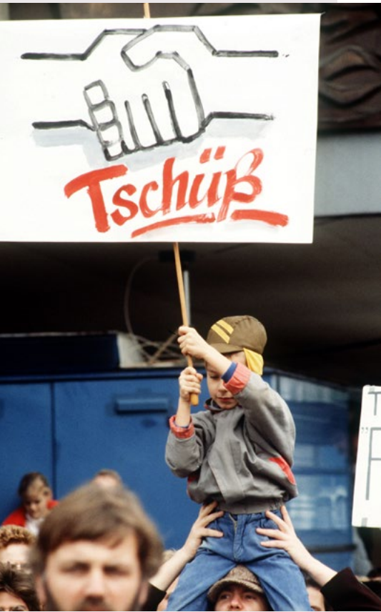
Protest gegen die SED-Diktatur am 4. November 1989 auf dem Alexanderplatz in Ost-Berlin

Am 18. Oktober 1989 trat Erich Honecker als Generalsekretär der Partei zurück, Egon Krenz beerbte ihn. Doch auch dieser Führungswechsel riss das Ruder nicht mehr herum. Wenige Wochen später, am 8. November 1989, demonstrierten zum ersten Mal öffentlich Parteimitglieder gegen ihre Führung und kündigten damit ihre Folgebereitschaft auf. Vor dem Sitz des ZK forderten sie einen Sonderparteitag. Die Macht der SED zerfiel in den kommenden Wochen. Am 3. Dezember trat die Parteiführung geschlossen zurück, viele lokale und regionale Parteifunktionäre hatten dies schon in den Wochen zuvor getan. SED-Mitglieder verließen scharenweise ihre Partei. Bis Anfang 1990 waren es mehr als eine halbe Million.