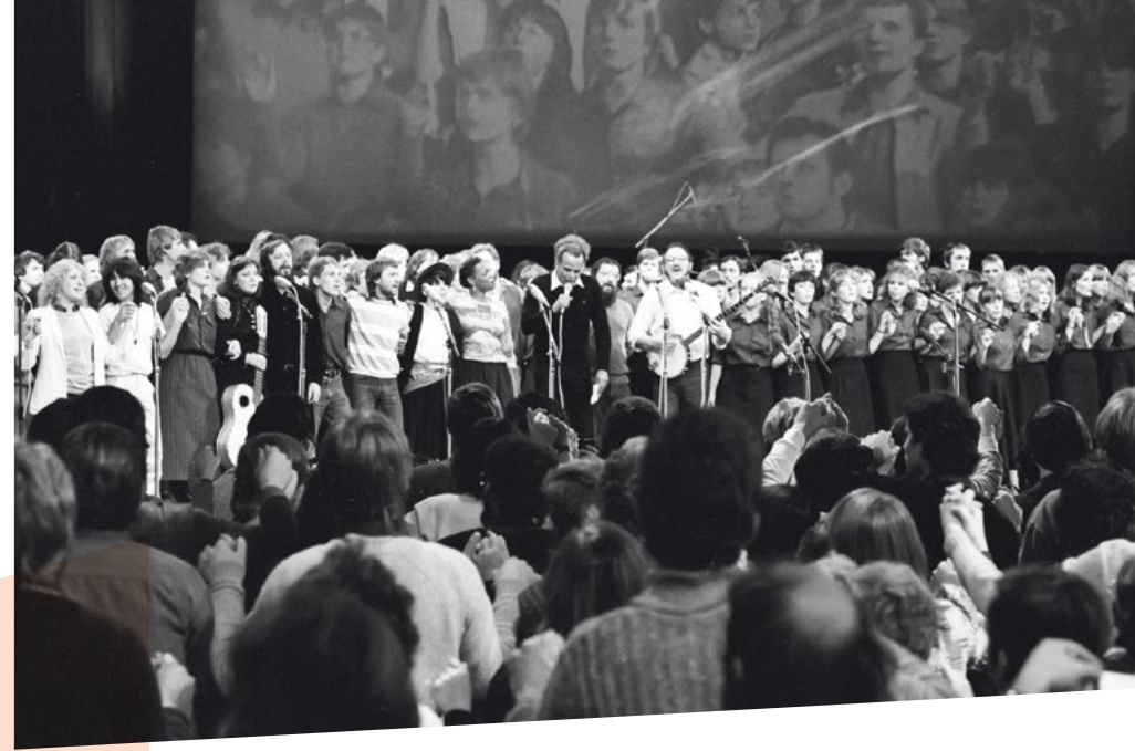
Der große Abschluss: Udo Lindenberg hält sich im Hintergrund.

lust fürchtend, griffen die Sicherheitskräfte schnell und energisch durch. Über die Gitter hinweg wurden einzelne Fans aus der Menge gezogen, etwa fünfzig verhaftet, „um ihnen dann in abspritzbaren Räumen jene Sonderbehandlung zukommen zu lassen, die der Sozialismus vorsah, wenn sich jemand nicht an das staatlich festgelegte Protokoll des Friedens hielt.“ 6 Brutal wurde gegen