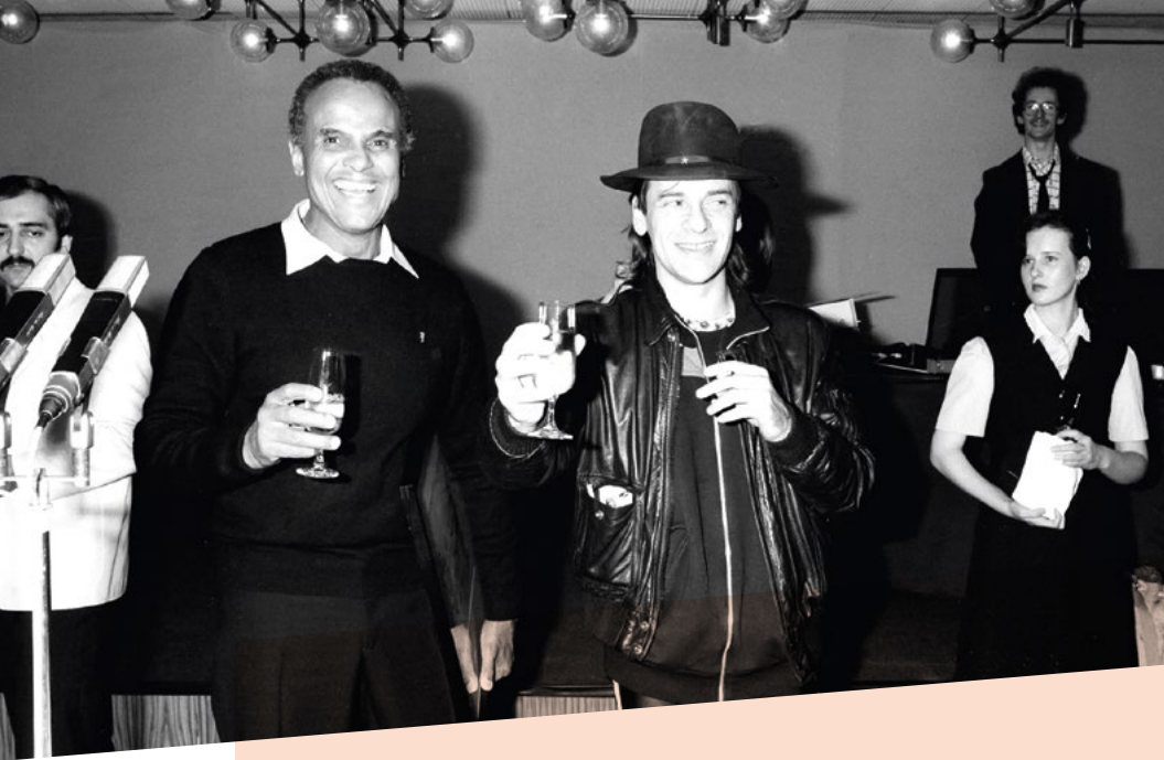
Aus verschiedenen Gründen die Stars des Abends: Harry Belafonte und Udo Lindenberg

War ein Auftritt Belafontes in der DDR aufgrund seines bisherigen politischen und sozialen Engagements durchaus erwartbar gewesen, so war das Erscheinen Lindenberg's eine kleine Sensation. Seit Jahren hatte er sich um eine Auftrittserlaubnis bemüht, war aber schon wegen seiner unberechenbaren, schnoddrigen Art stets auf Ablehnung bei den Entscheidungsträgern gestoßen. Lindenberg-Fans gab es in dem kleinen deutschen Staat zuhauf, der Musiker wurde teils inbrünstig verehrt, doch das politische Establishment sah in ihm vor allem eines: einen möglichen Störfaktor.