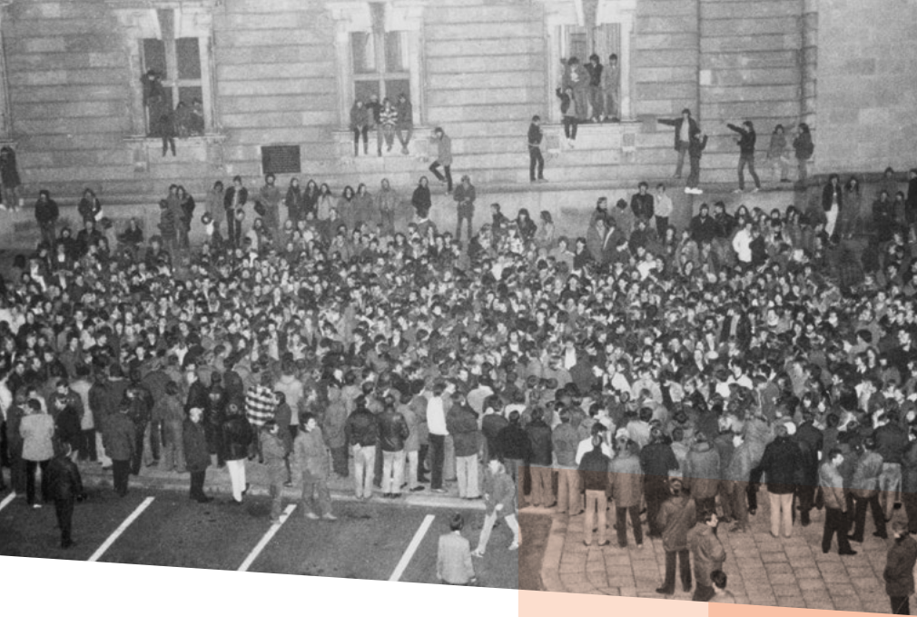
Die wahren Udo-Fans treffen sich am Palast der Republik, kommen aber nicht hinein.

Während im Inneren des Palasts der Republik also eine bizarre Inszenierung abließ, hatte sich vor dem Gebäude eine völlig andere Situation entwickelt. Seit 17 Uhr war es durch Sperrgitter abgeriegelt. Immer mehr Jugendliche strömten herbei und forderten, von der Dunkelheit nur unzureichend geschützt: „Wir wollen Udo haben, wir wollen rein!“ Offensichtlich einen Kontrollver-