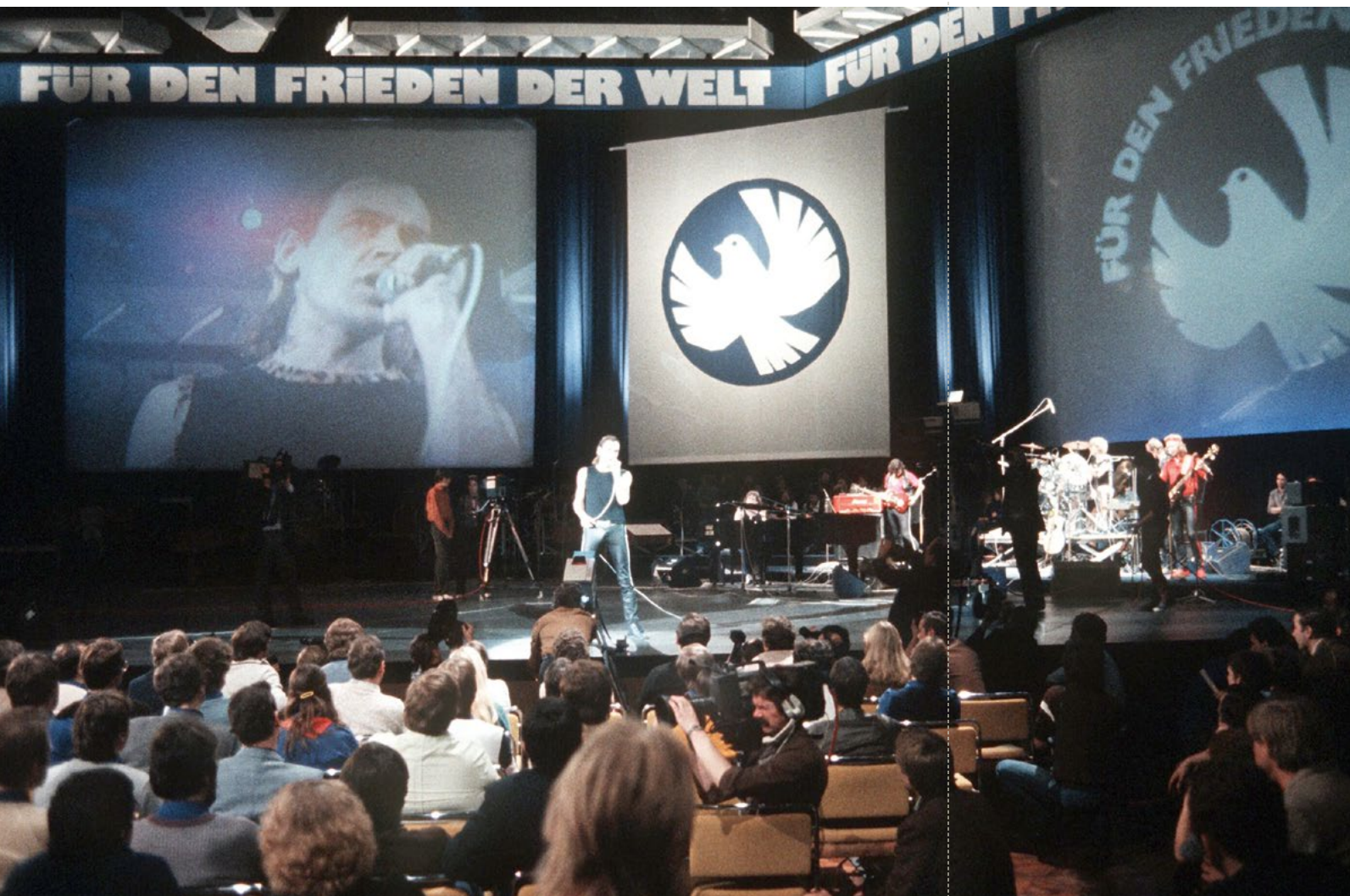
Auftritt von Udo Lindenberg mit dem Panikorchester am 25. Oktober 1983 im Ost-Berliner Palast der Republik

Anschließend absolvierten Lindenberg, Belafonte und andere die Pressekonferenz, und pünktlich um 19 Uhr begann die Veranstaltung im Palast. Sehr schnell stellte sich nun heraus, dass dies keineswegs ein normaler Konzertabend war. Im Saal saßen ausschließlich linientreue FDJ-Mitglieder, zumeist in der offiziellen Kleidung des Verbandes. Keine einzige Eintrittskarte war in den freien Verkauf gelangt, das Publikum vom System quasi handverlesen. Entsprechend zurückhaltend fielen die Reaktionen auf die Darbietungen aus. Das Publikum klatschte artig, mehr aber auch nicht, die Stasi attestierte ihm hinterher „eine hohe Disziplin“. Lindenberg sang vier Lieder und versuchte vergeblich, Stimmung im Saal zu erzeugen. Im Laufe des Abends wurde immer wieder die Aufrüstung des Westens angeprangert, vom Ostblock jedoch war nicht die Rede. Das aber durchbrach Lindenberg, indem er klar Stellung bezog: „Weg mit allem Raketenschrott, in der Bundesrepublik, in der DDR – nirgendwo wollen wir auch nur eine einzige Rakete sehen.“ 5